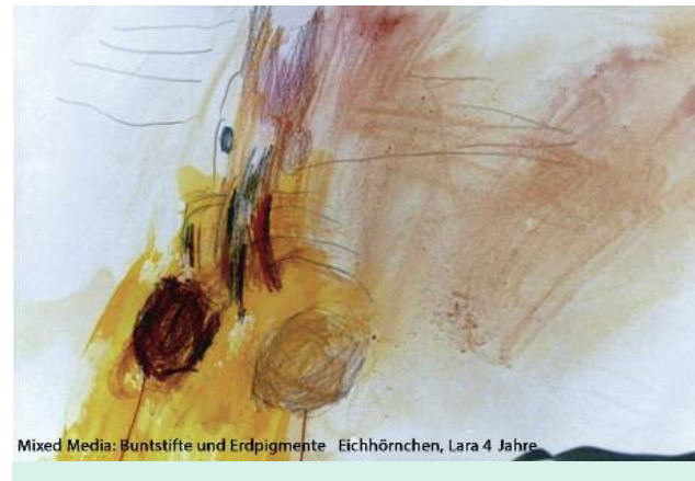
Mixed Media: Buntstifte und Erdpigmente Eichhörnchen, Lara 4 Jahre