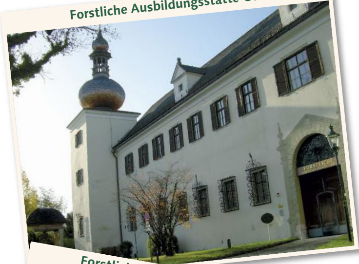
Forstliche Ausbildungsstätte Ossiach